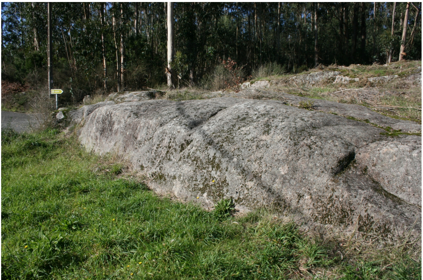
Afloramento sobros os cales se atopan os gravados de Laxe da Serpe