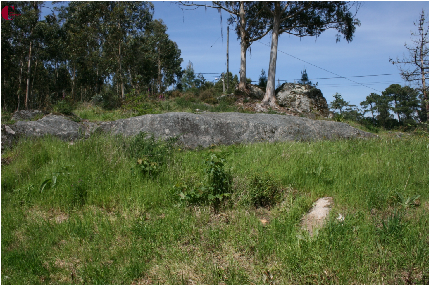
Laxe da Serpe