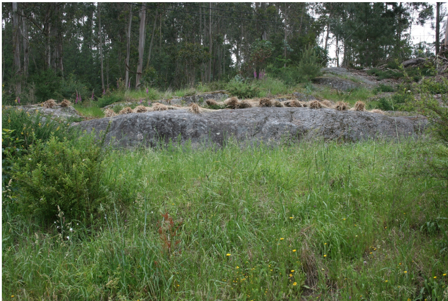
Sobre o afloramento que se atopan as gravuras seguese depositando os cereal para o seu secado

ciclo da lúa. Os ritmos luars marcan sempre unha creación, lúa nova, seguido dun crecemento (lúa chea) e dun decrecer e morte, que tras tres noites sen lúa volve rexurdir; o que lle confire dun carácter cíclico á concepción ao tempo (morte e resurrección permanente).