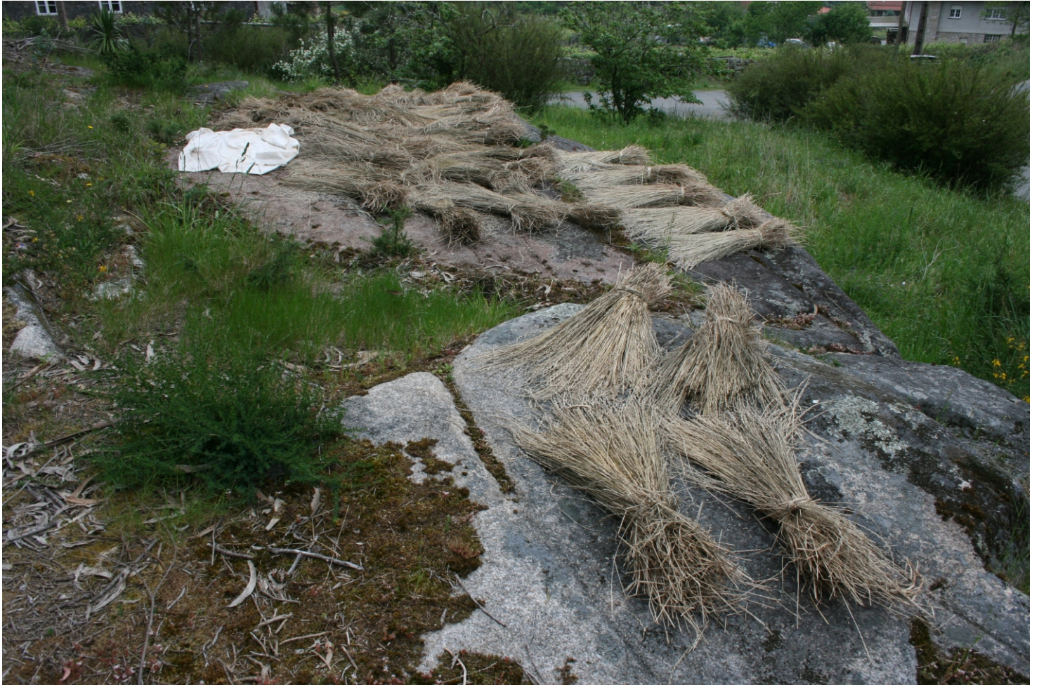
Sobre o afloramento que se atopan as gravuras seguese depositando os cereal para o seu secado

representación iconográfica dunha corda, que xunto cos outros trazos sinuosos que representaría nós e lazos, están a fixar ideas, valores, crenzas e sentimentos que configuran o imaxinario colectivo dun pobo e dun tempo pasado.