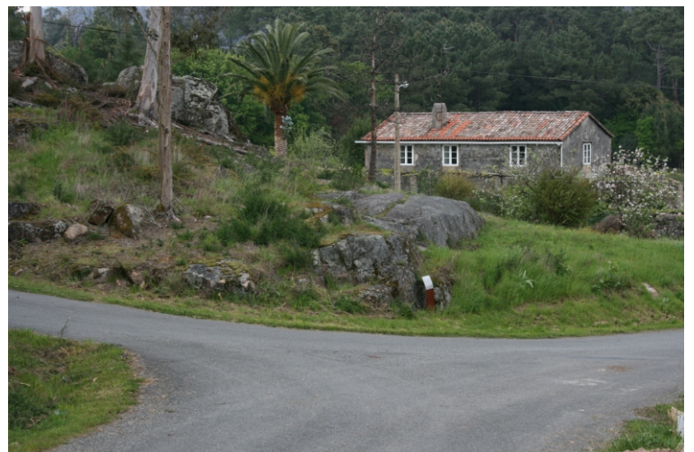
Laxe da Serpe

Dicía Risco que “cando hai un cambio fondo na conciencia do pobo, como acontez nos troques de relixión, crébase a relación co pasado; faise un corte, cunha escisión entre o onte e o hoxe, e os nosos antepasados doutras crenzas xa non son nosos antepasados, xa non teñen que ver connosco”, e dicir, prodúcese unha perda de significado, unha ruptura, unha transposición do sentido transformando o imaxinario colectivo que non nos permite hoxe recoñecer tan sequera que motivo se atopa representado.